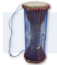
Tambour d'aisselle mossé (2000.137.3.1)