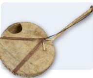
Vièle monocorde touareg (2000.135.1.1)