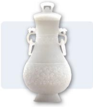
Vase chinois (80-441.1-3)