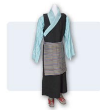
Costume tibétain (87-8.0)