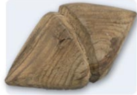
Toupie coréenne (80-364)