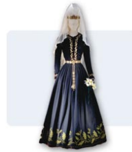
Vêtement de noces islandais (69-94.0)