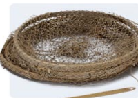
Filet de madrague allemand (84-155.1)

Facultatif : Consultez la base de données d'artefacts et choisissez des artefacts en rapport avec un sujet que vous explorez; tirez une copie d'un enregistrement d'artefact par étudiant ou sauvegardez les enregistrements pour les afficher au projecteur.