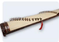
Cithare sur table vietnamienne (2000.136.4.1)