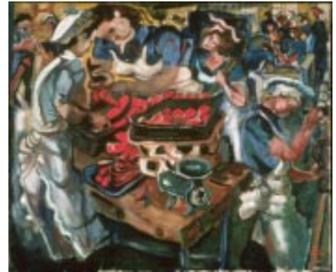
Saumon dans la coquerie , Pegi Nicol MacLeod, 1944 MCG 14215

Les femmes artistes ont pour la plupart été embauchées pour peindre le travail des femmes, mais au cours de la Première Guerre mondiale, le monde du travail a évolué, des milliers de femmes occupant des emplois habituellement réservés aux hommes. L'impressionnante représentation d'ouvrières remplissant des douilles dans une manufacture de munitions, œuvre de Mabel May, illustre les répercussions de la guerre sur la présence des femmes au travail, celles-ci assumant de nouvelles responsabilités pour soutenir l'effort de guerre. La peinture lyrique de Manly MacDonald, Jeunes paysannes en train de sarcler , illustre aussi la mesure dans laquelle les femmes ont remplacé les hommes partis au combat.