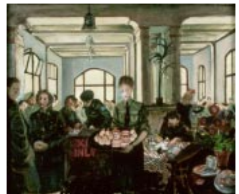
Cantine, Nimègue , Molly Lamb Bobak, 1945 MCG 12017

Hollande après le jour de la Victoire en Europe et elle a représenté les tâches et les expériences des femmes soldats outre-mer.