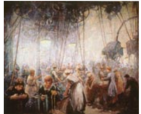
Femmes fabriquant des obus , Mabel May, 1919 MCG 8409

Trois services féminins ont été créés au cours de la Deuxième Guerre mondiale : le Service féminin de l'Armée canadienne, le Service féminin de la Marine royale du Canada et la Division féminine de l'Aviation royale du Canada. Les femmes, militaires et civiles, se voyaient confier de nouvelles tâches, par exemple la construction des avions, mais également d'autres fonctions plus traditionnelles comme le travail de bureau.