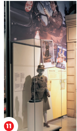
11 Iskwêw simâkan'sihkânâk Canada ohci