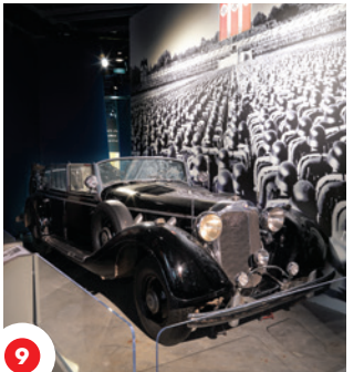
9 Hitler sô kârr/ocâpânâskosa