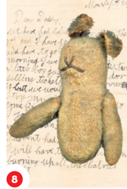
8 Ciyadôrr omashkwomisa