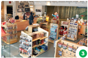
3 Nanâtohk kikwâs atâwêwikamikos