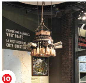
10 Sikipahcwânîsak l'balôn pahkishikan