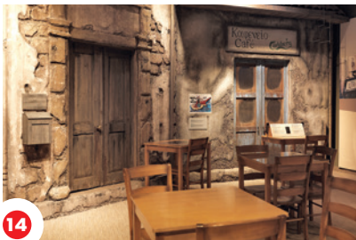
14 Cyprus kâ ishkâtik