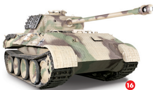
16 Panzerkampfwagen V Panther Ausf A kâ ishkâsot