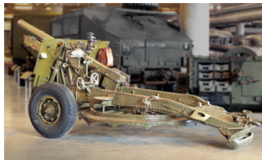
17 Kâ kisikotik nistanaw niyânôsop kâ kishikwa pâskisikan