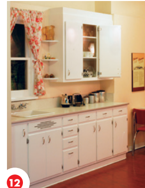
12 Kâwî piyahcak kâstik pimât'sowin