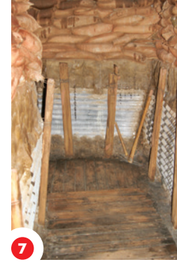
7 Ta kakwî pimâcihisoyin pihcâyihk ôta ôhi latârr wâcihcikânisâ