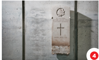
4 Nimwî kâ nistawîmiht simâkan'sihkân asinêw la krrwâ