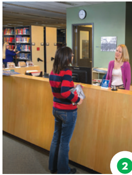
2 Ôta mâna kâ kitâpahtahkwâw kâyâsêw notin'kêw âpacihcikana