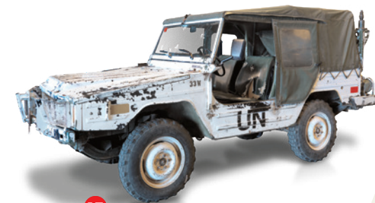
13 Kâ yahkit'sit ocâpânâskos