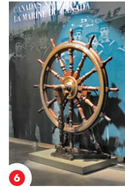
6 Ôma l'krrô batô HMCS kimowanîyâpî Ship kâ ishkâtik lirrô