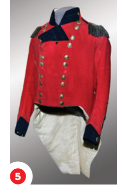
5 Isaac Brock sô Tunic